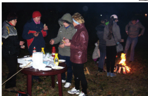
Spotkanie organizacyjne zorganizowane w formie ogniska