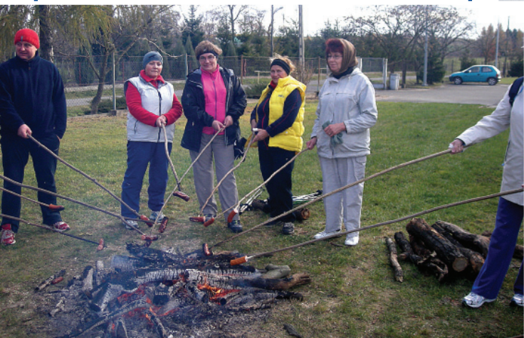
Spotkanie organizacyjne zorganizowane w formie ogniska